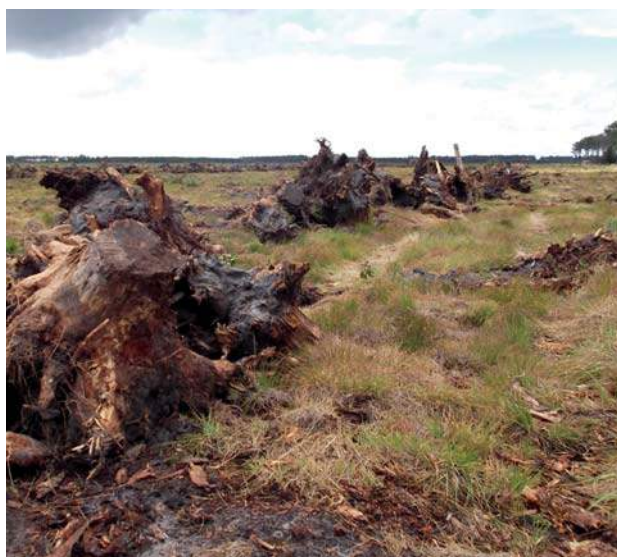
Mise en cordons des souches, (Photo Dominique Merzeau, IDF-CPFA).

Le dessouchage complet avec récupération des souches offre un avantage : il facilite les opérations ultérieures