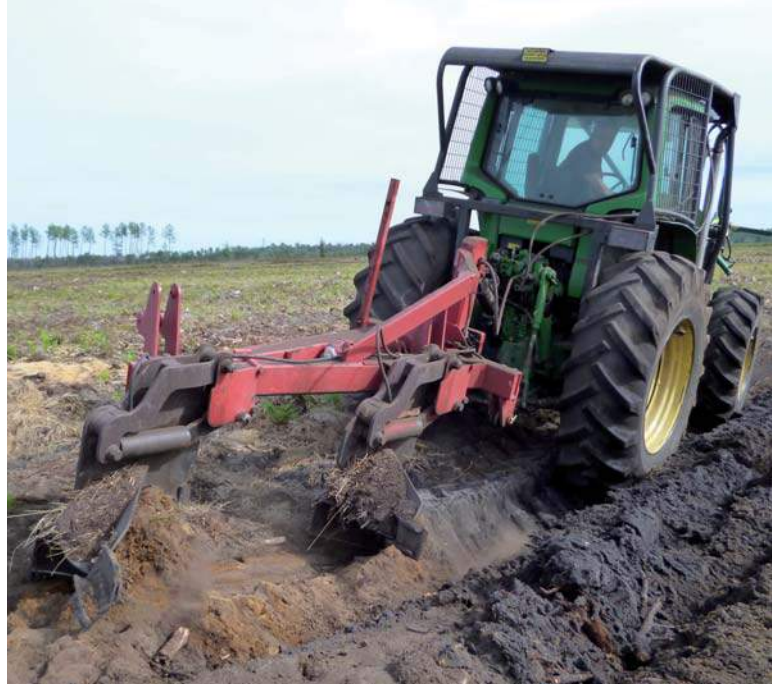
Labour en plein.

Le labour en bandes (ou labour partiel) est la technique la plus répandue : elle consiste à ne labourer qu'une fraction de la surface. Dans la mesure du possible, il serait préférable de faire quatre traits de charrue plutôt que trois