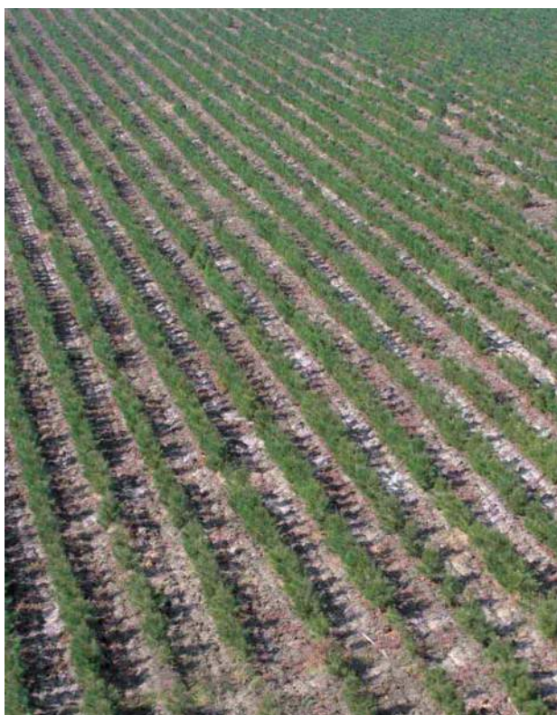
Jeune plantation de pin maritime.

Une variante possible consiste à créer des écartements variables avec un motif alterné : groupes de quatre lignes à faible écartement (3,50 m) séparés par des interlignes de 5 m. Cet interligne plus large est alors dédié au passage des engins d'exploitation : on évite ainsi la difficulté d'entretien des lignes à 3 m.