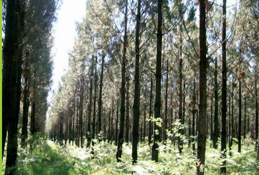
Plantation de pin maritime.

Les traités de sylviculture moderne publiés au cours des années 1980 (Chaperon, 1986, Maugé, 1987) ont largement décrit les bases de la ligniculture. Ce concept de ligniculture a permis de définir les itinéraires mis en œuvre lors du reboisement en pin maritime dans le massif landais. Deux pratiques ont été promues : le travail du sol et la fertilisation. Ces deux éléments sont des facteurs essentiels des gains de production constatés sur les peuplements créés depuis plus de 40 ans et sont encore d'actualité aujourd'hui, même si les techniques, les outils et les itinéraires ont fortement évolué au cours du temps. Les deux tempêtes de 1999 et de 2009 ont parfois suscité des interrogations sur le bien-fondé de ces pratiques en suggérant que les peuplements créés et conduits en ligniculture intensive sont moins résistants lors de forts coups de vents. La fertilisation, le reboisement en ligne et les techniques de labour ont parfois été remis en cause. A l'aube de la reconstitution consécutive à la tempête de 2009, il semble nécessaire d'une part, de rappeler les acquis importants que ces différents procédés apportent à la sylviculture du pin maritime dans le massif landais, et d'autre part de formuler les interrogations soulevées et les pistes de recherche concernant la durabilité de la production dans un contexte changeant (climat, économie, utilisation de la ressource...).