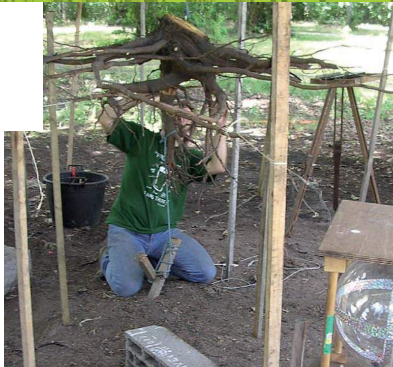
Numérisation d'un système racinaire en trois dimensions.

Lorsqu'une racine traçante de pin est coupée par une lame, elle émet à partir de la blessure une demi-douzaine