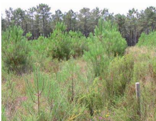
Effet de la fertilisation en phosphate : arbres non fertilisés au premier plan, fertilisés au deuxième plan.