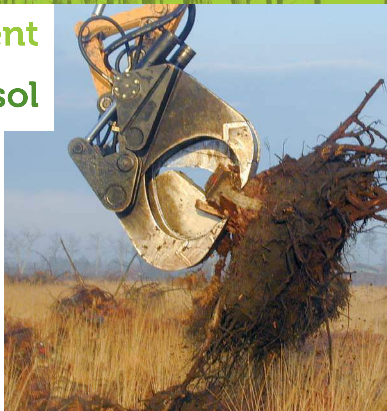
Le dessouchage est une opération indispensable en cas de chablis.

(débroussaillage, labour, reprise) contribuant ainsi à diminuer les temps de travaux : sur chantiers pilotes, des gains de 5 à 7 % sur le temps nécessaire au labour ont pu être estimés. Deux inconvénients ont été recensés : le coût de l'opération si les souches ne sont pas valorisées, et les exportations en éléments minéraux et en carbone.