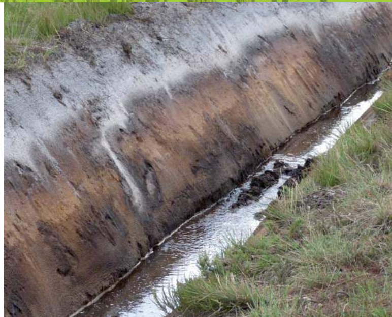
La couche d'aliOS constitue un obstacle à la colonisation en profondeur des racines du pin maritime (Photo Jean-Baptiste Ornon, INRA).

Les sols landais sont des podzols avec une formation ancienne de micro-creux « mouilleux » et de micro-crêtes. Sur les micro-crêtes, au niveau de l'horizon d'accumulation, le sable s'est soudé très fortement avec de la matière organique ou des oxydes, aboutissant à la formation de l'aliOS. Ce dernier, plus ou moins induré, plus ou moins fissuré, rarement continu, se présente sous forme de bandes ou « loupes » à des profondeurs variant entre 40 et 120 cm. Lorsqu'il est dur, il empêche la progression des racines du pin qui forment alors une sorte de bouclier à son contact, accompagné d'un fort feutrage. La présence de l'aliOS limite le volume de sol exploré par les racines, mais offre probablement aussi un bon support mécanique pour le système racinaire lorsqu'il est à plus de 70 cm de profondeur. Du fait de la forte variabilité de la distribution de l'aliOS au sein même des parcelles et de ses effets contradictoires sur la stabilité, en fonction de sa profondeur, il n'est pas étonnant que les résultats des expérimentations de sous-solage soient parfois incohérents : celles menées dans les années 1970 par l'AFOCEL et l'ONF n'ont pas permis de prouver une réelle efficacité de cette technique tant sur la croissance que sur la stabilité au vent des peuplements. La compréhension du