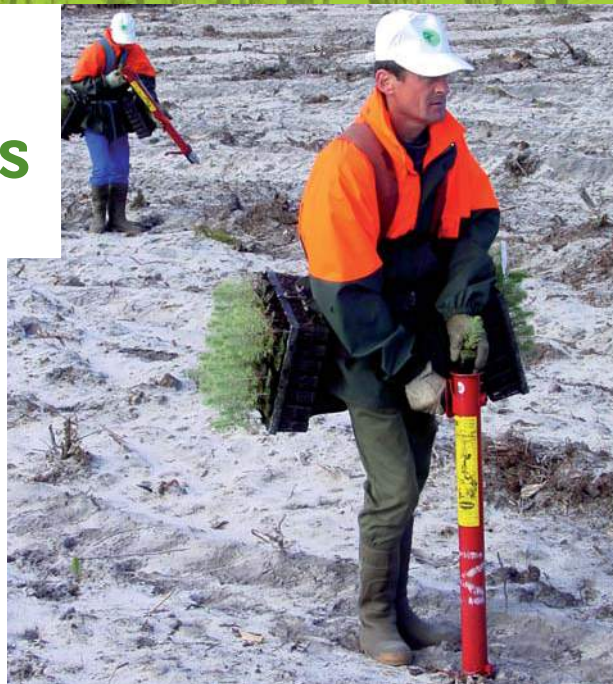
Plantation au tube à planter.

Il est important, au moment de la plantation de faire attention à la micro-topographie du terrain et il est