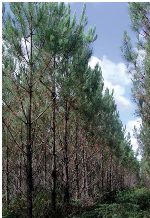
Plantation de pin maritime (Photo Pierre Alazard, FCBA).

Toutes ces thématiques font l'objet d'expérimentations en cours ; citons entre autres, les projets d'adaptation des forêts au changement climatique (CLIMAQ), le programme d'amélioration génétique et sylvicole du pin maritime (FORTIUS) et la plateforme d'étude de scénarios innovants de production de biomasse ligneuse (XYLOSYLVE) ; ces recherches sont le garant d'une réflexion raisonnée pour la gestion à long terme des forêts de production de pin maritime dans le massif landais.